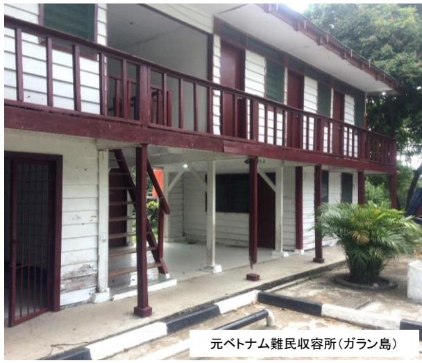
元ベトナム難民収容所(ガラシ島)