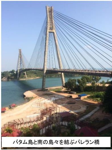
パタム島と南の島々を結ぶパラレン橋